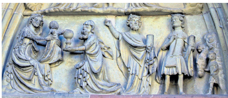
Das steinerne Relief am Nordportal der Kapellenkirche strahlt insgesamt noch Würde und Ernst des Mittelalters aus.

In lateinischer Sprache beschäftigt dieser Text sich mit dem möglichen Sinngehalt des Wortes „drei“ und bringt es hier in Bezug zu den drei Gaben der Dreikönige, zu den Königen selber und zuletzt zur Dreifaltigkeit Gottes. Der Verfasser des Textes weist sich so sprachlich und theologisch als gleichermaßen versiert aus.