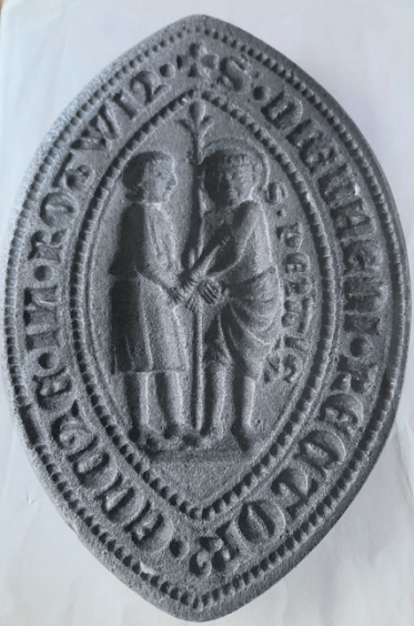
Dieses Siegel ist in der Gegend von Dornhan aufgetaucht.

offensichtlich verbinden soll. Die Umschrift des Siegels lässt sich mit