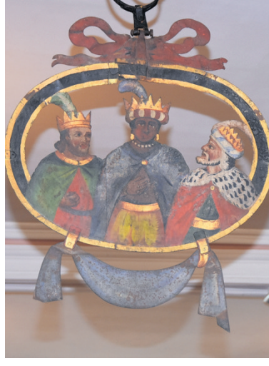
Das Wirtshauschild des „Dreikönig“, Hochmaiengasse.

Wie sehr sich das Dreikönigsmotiv im Lauf der Zeit vom religiös-kirchlichen Bereich in den Alltag hinein entwickelte, wird mit einem Blick auf die städtischen Wirtshäuser deutlich. In Rottweil gab es einen „Stern“, einen „Mohren“, ein „Kamel“ und einen „Dreikönig“ - diesen