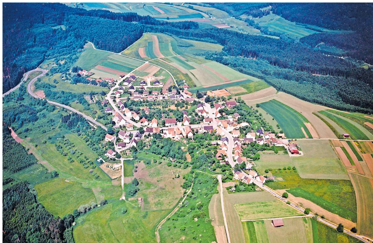
Feckenhausen darf auf eine spannende Historie blicken.

Beim Jahrgericht handelte es sich also um ein Niedergericht, ein Gericht für die leichteren Straffälle, die nicht mit der Todesstrafe bedroht