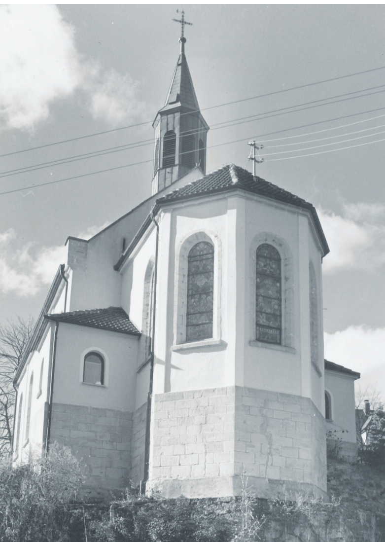
St. Michaelskapelle Feckenhausen, Aufnahme von 1986.