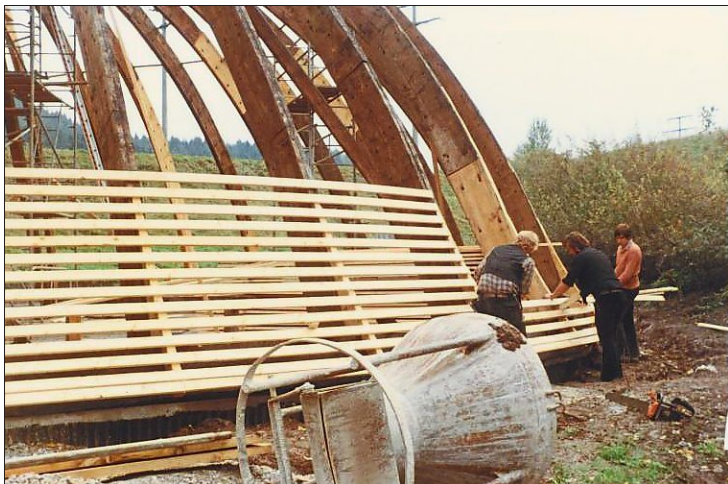
Wiederaufbau eines Solerundbehälters im Jahre 1983 auf dem Gelände des Salinenmuseums Unter Bohrhaus.