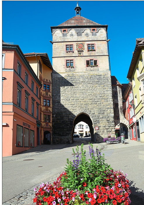
Im Schwarzen Tor in Rottweil verbüßte das „Schafbüble“ aus Schweningen offenbar mehrere Haftstrafen.

In den Taufregistern tauchen von 1822 bis 1829 mehrere Täuflinge namens Christian Schlenker auf. Die Recherche in Familienregistern und Mischbüchern hat die Zahl der möglichen Personen auf zwei bzw. dann auf einen reduziert. Christian Schlenker geboren am 8. Mai 1825 in Schweningen – damals noch Oberamt Tuttlingen. Im Taufregister wird der Vater folgendermaßen angegeben: „Der angegebene Vater Mi-