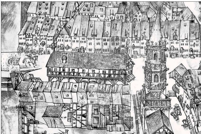
Das Kaufhaus in der Form eines zweigeschossigen Fachwerkbaus, das bis 1796 im Straßenraum der Hochbrücktorstraße stand; Darstellung auf der Pürschgerichtskarte von 1564.

Zum Vergleich können zwei Beispiele von Schützenhäusern herangezogen werden, deren Baugestalt dokumentiert ist, auch wenn sie in beiden Fällen nicht auf Armbrust- sondern auf Büchenschützen zurückgingen. Der Schießplatz von Schwäbisch Gmünd lag südlich der Stadt vor dem Waldstetter Tor. Auf einer Seite der Straße lag die Schießbahn mit Schießstand, auf der anderen das Schützenhaus. In dem um 1810 entstandenen zwölften Band der Chronik Dominikus Deblers findet sich die zeichnerische Darstellung eines zweigeschossigen Fachwerkbaus. Im Obergeschoss lag hinter einer durchgehenden Reihung verglaster Fenster mit zierenden Bekrönungen eine Zechstube. Offenbar besaß das Erdgeschoss zunächst offene Lauben oder Toröffnungen, die nachträglich mit Fachwerk geschlossen wurden.