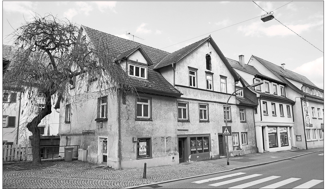
Das Gebäude in der Waldtorstraße 12 mit nur zwei Geschossen und breit gelagertem Quergiebel.

Vermutlich zu Beginn des 13. Jahrhunderts hatte man das Siedlungsgebiet von der südlich gelegenen sogenannten Mittelstadt an die strategisch günstige Stelle hoch über dem Neckar zwischen zwei tiefen Taleinschnitten verlagert. Der neu ausgelegte Stadtgrundriss bekam ein Kreuz aus breiten Marktstraßen und einen etwa