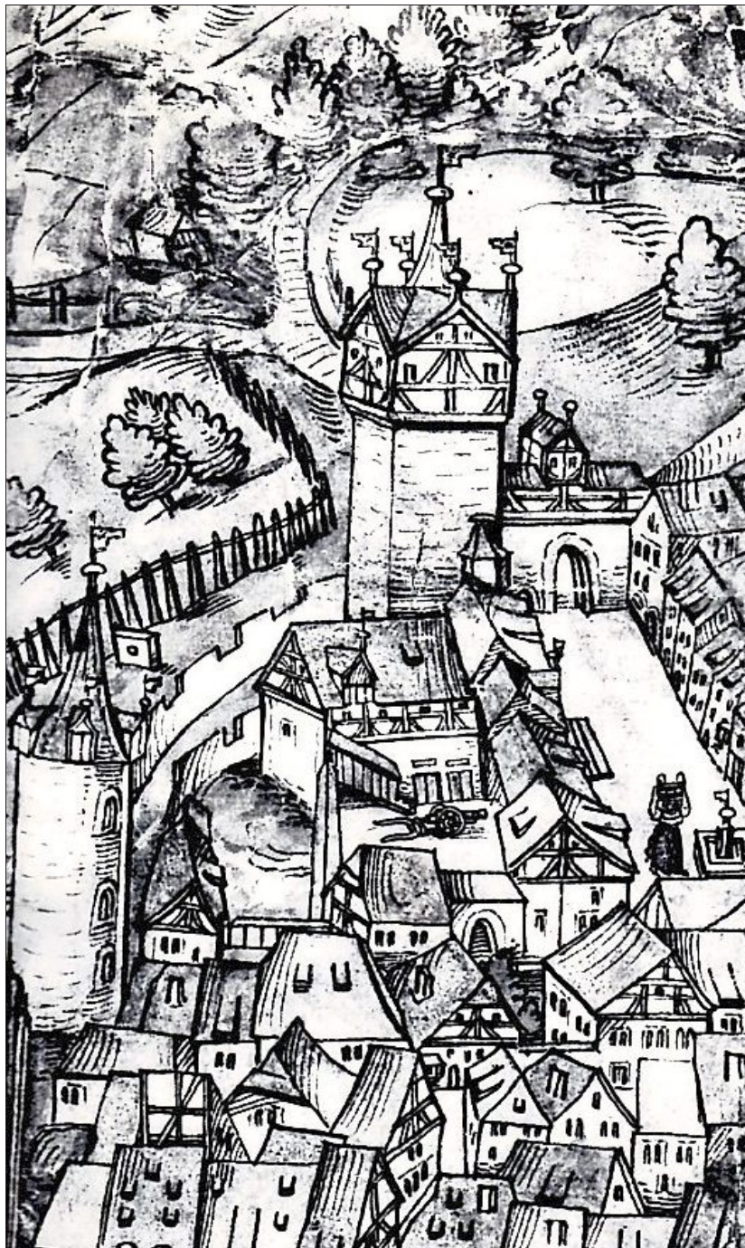
Inhaftiert waren die der Hexerei Verdächtigen im Hochturm oder dem zinnenbekrönten Roten Turm beim Neutor.

In den 1470er-Jahren kam es zu einer erneuten