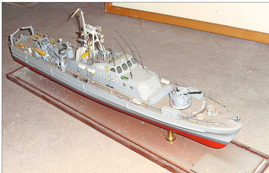
Ein Modell der „SM Castor“, welches im Oktober 1965 beim ersten Besuch der Besatzung als Geschenk übergeben wurde. Das etwa einen Meter lange Modell wurde in einjähriger Arbeit von zwei Besatzungsmitgliedern gebaut. Anfangs stand das Modell im Schaufenster des Museums in der Hauptstraße und wurde auch später im Rathaus ausgestellt (10).

Die schnellen Minensuchboote waren eine Weiterentwicklung der bisherigen Minenräumboote. Die „Castor“ gehörte zur Schütze-Klasse, die nach dem ersten in Dienst gestellten Boot dieser Klasse benannt wurde. Alle weiteren Boote dieser Klasse erhielten ebenfalls Namen von Himmelskörpern und Sternbildern und waren weitestgehend, zum Schutz gegen Magnetminen, aus Holz gebaut. Die „Castor“ war das 17. von 30 Booten (sechs weitere Boote dieser Klasse kamen bei der brasilianischen Marine zum Einsatz), die von 1959 bis 1963 in Dienst gestellt wurden und wurde als zehntes Boot des 1. Minensuchgeschwaders in Flensburg stationiert. Dieses Geschwader bestand aus einem