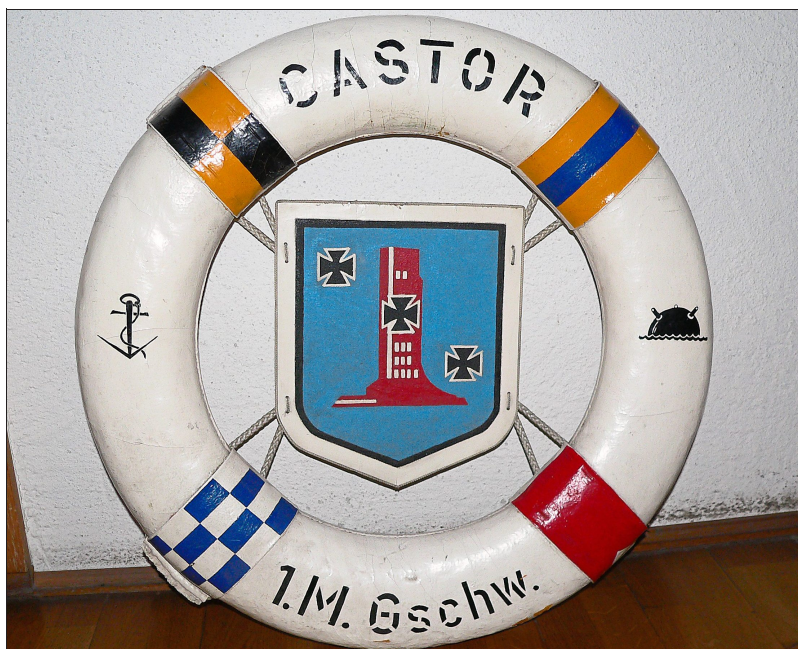
Ein Rettungsring für Rottweil: ein Gastgeschenk, selbstverständlich ohne jeden Hintergedanken.

(10) SchwaBo 20. Oktober 1965, SchwäZ 24. Mai 1973