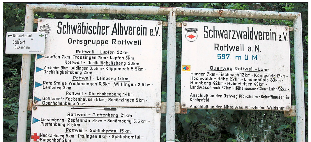
Schon seit Generationen laden Albverein und Schwarzwaldverein Seite an Seite am Bahnhof zu Wanderungen von Rottweil aus ein.

Der „Schwarzwaldbezirksverein Rottweil“ wurde einem mit Bleistift ausgeführten Nachtrag in seinem Protokollbuch von 1904 im Jahre 1902 „gestiftet“ (Protokollbuch der OG Rottweil des Württ. Schwarzwaldvereins 1904-1906 (zit.: Protokollbuch) S.3). Tatsächlich findet sich in der Nr. 149 der Schwarzwälder Bürgerzeitung (zit.: SBZ) vom 3. Juli 1902 ein Aufruf, zur Gründung eines Rottweiler Bezirksvereins des Schwarzwaldvereins am 4. Juli 1902 im Billardzimmer der „Liederhalle“ in Rottweil zusammenzukommen. Auch wenn dieser Aufruf namentlich nicht gezeichnet war, konnte in der gleichen Zeitung wenig später berichtet werden, dass die angestrebte Vereinsgründung „einem längst und vielseitig empfundenen Bedürfnis“ entsprach und zum Erfolg führte (SBZ Nr. 151 vom 5. Juli 1902). Hervorgehoben wurde im betreffenden Artikel, man strebe „treue